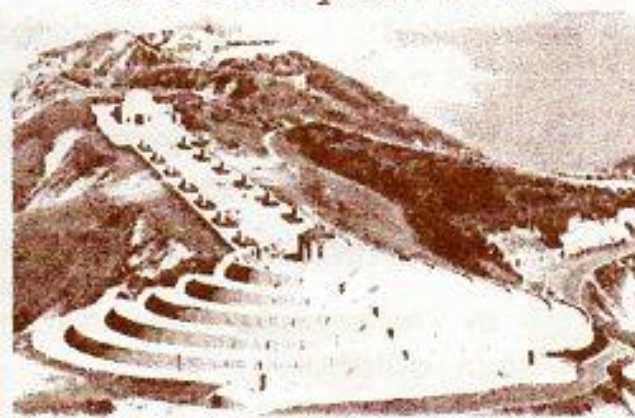
Sacratio del Monte Grappa