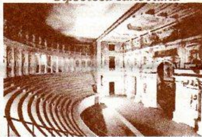
Teatro Olimpico Vicenza