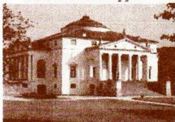
Villa La Rotonda