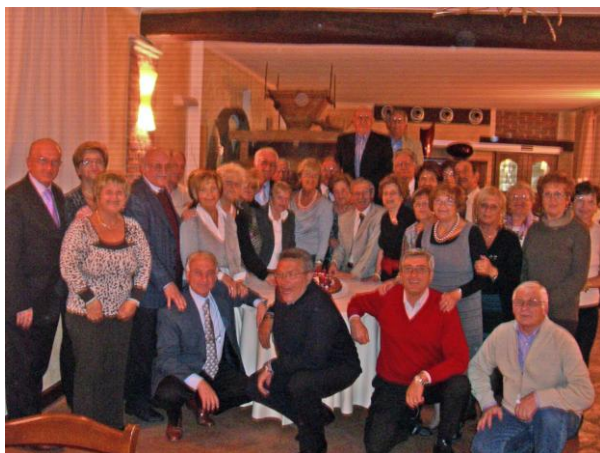
Cena del 2011

CENA di COSCRITTE e COSCRITTI presso Agriturismo "MOLINO SANTA MARTA" a Casterno di Robecco sul Naviglio